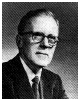
Профессор д-р Дональд Хебб