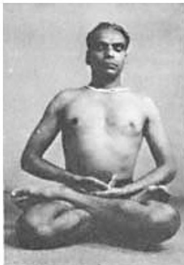
Б.К.С.Айенгар в позе падмасана

«Когда всматриваешься в сияющее солнце в гипофизе и при этом остаешься в позе «лотоса», вскоре чувствуется внутренний жар в основании позвоночника ( Муладхара ), который потом по доходит до затылка. При переходе в позу горакишасана или если просто вытянуть ноги, этот жар прекращается. Он возвращается, если снова перейти в позу «лотоса».